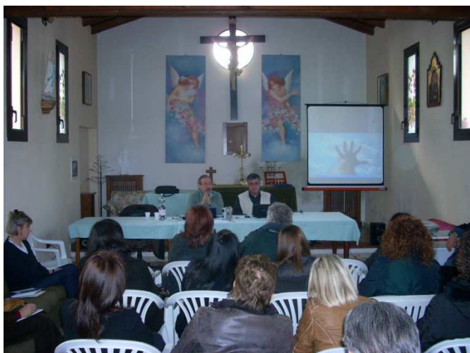
Foto1 - Veduta d' Insieme

Sono state scattate anche delle foto che di seguito farò vedere. Tra queste ve ne è una con una “anomalia” che mi è saltata agli occhi. Questa foto è stata esaminata successivamente anche da G.Paolo il quale mi ha confermato la presenza di un volto che a me sembra quello di mia madre.