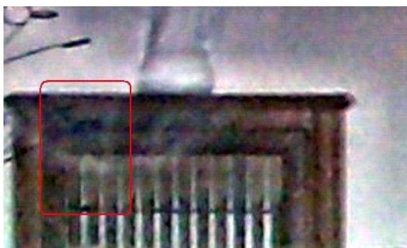
Foto 3 Particolare anomalia